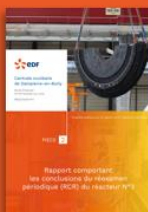
2 - Rapport du 4 e réexamen périodique