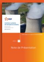
1 - Note de présentation

Le public sera invité à consulter les dossiers dans les mairies des communes du périmètre de 5 km autour de la centrale : Dampierre-en-Burly, Ouzouer-sur-Loire, Nevoy, Lion-en-Sullias, Saint-Florent, Saint-Aignan-le-Jaillard et Saint-Gondon.