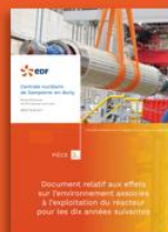
3 bis - Document relatif aux effets sur l'environnement associés à l'exploitation du réacteur pour les dix années suivantes