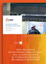
4 - Bilan de concertation mise en œuvre pour la partie commune du 4 e réexamen périodique des réacteurs