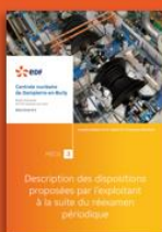
3 - Description des dispositions proposées par EDF à la suite du réexamen périodique