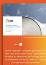
5 - Textes régissant l'enquête publique ainsi que son articulation avec la procédure relative au réexamen périodique prévu au troisième alinéa de l'article L. 593-19 du code de l'environnement