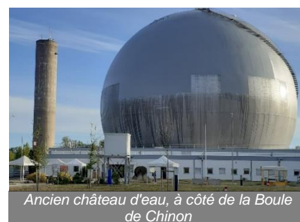
Ancien château d'eau, à côté de la Boule de Chinon

Ces derniers jours, les fauconneaux commencent à perdre leurs duvets de bébé et s'habillent peu à peu d'un plumage d'adulte. Cependant, il leur reste encore quelques semaines avant qu'ils ne prennent leurs envols pour se disperser dans les environs.