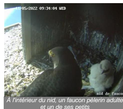
À l'intérieur du nid, un faucon pèlerin adulte et un de ses petits

Acteur majeur de la transition énergétique, le groupe EDF est un énergéticien intégré, présent sur l'ensemble des métiers : la production, le transport, la distribution, le négoce, la vente d'énergie et les services énergétiques. Leader des énergies bas carbone dans le monde, le Groupe a développé un mix de production diversifié basé sur l'énergie nucléaire, l'hydraulique, les énergies nouvelles renouvelables et le thermique. Le Groupe participe à la fourniture d'énergies et de services à environ 37,9 millions de clients (1), dont 28,1 millions en France. Il a réalisé en 2020 un chiffre d'affaires consolidé de 69 milliards d'euros. EDF est une entreprise cotée à la Bourse de Paris.