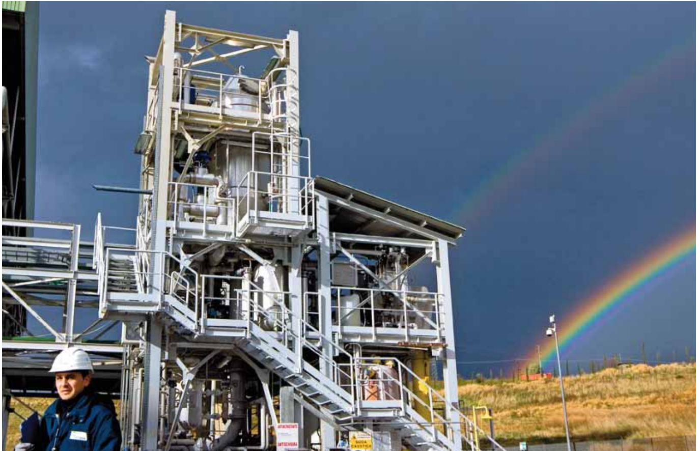
Centrale à cycle combiné gaz d'Altomonte. Toutes les installations de production d'Edison ont obtenu une certification environnementale.

SA. Il fixe plusieurs priorités : la sécurité des approvisionnements, la sûreté et la sécurité des installations, l'aménagement du territoire, une évolution des tarifs aux particuliers au même rythme que l'inflation, la lutte contre l'effet de serre, la préservation de l'environnement, la solidarité nationale, la lutte contre l'exclusion, le service de proximité.