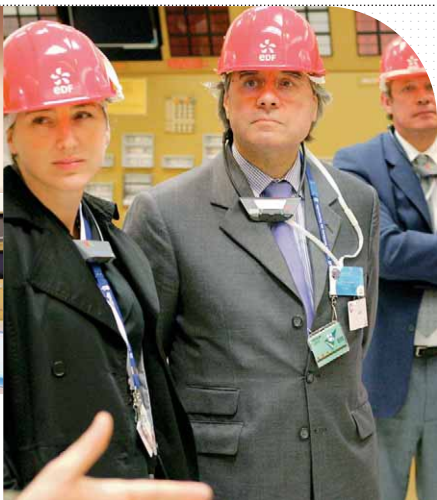
▲ Sur le site de la centrale nucléaire de Flamanville, lors de l'« Investor Day », journée à destination de la communauté financière.

EDF a pour ambition de construire une relation solide avec la communauté financière, et de structurer et développer son actionnariat institutionnel.