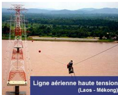
Ligne aérienne haute tension (Laos - Mékong)