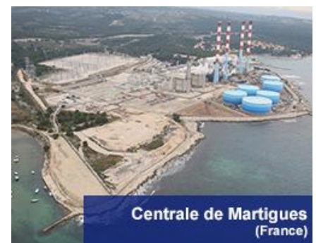
Centrale de Martigues (France)

A Martigues, où un grand chantier de repowering s'est achevé en 2012, le repowering consistait à reconvertir une centrale thermique fonctionnant au fioul en une centrale thermique fonctionnant au gaz tout en augmentant sa puissance. L'enjeu était de réutiliser autant que possible le matériel existant. L'équipe du CIST s'est chargée de la partie évacuation de l'électricité de la centrale et son raccordement au réseau (de l'appui amont au projet jusqu'à l'assistance à la maîtrise d'ouvrage).