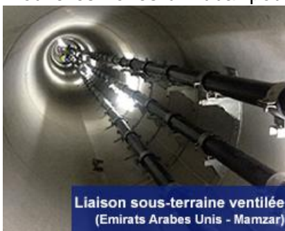
Liaison sous-terrine ventilée (Emirats Arabes Unis - Mamzar)

De 2009 à 2013, le CIST est intervenu comme consultant - des premières études au dépouillement des offres des différents constructeurs - de la Compagnie d'Electricité de Dubaï. Le projet : relier de nouvelles zones à Dubaï pour appuyer le développement économique, grâce à deux câbles enterrés dans des tunnels de 11 et 4 km. Les solutions ont été adaptées aux conditions climatiques et à la consommation irrégulière de Dubaï. Afin de refroidir les câbles en période de forte chaleur et de forte consommation, la solution préconisée a été double :