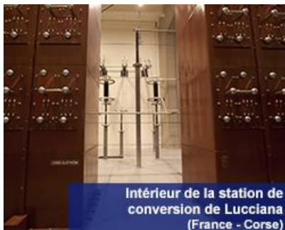
Intérieur de la station de conversion de Lucciana (France - Corse)