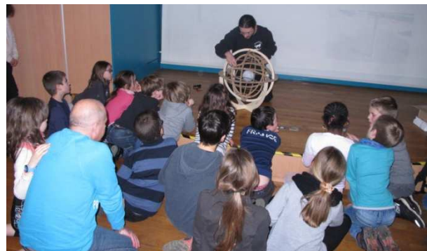
La sphère armillaire permet de visualiser le mouvement des étoiles autour de la terre.

Mercredi 27 janvier 2016, une quarantaine d'enfants accompagnés de leurs parents se sont initiés aux mystères intergalactiques, lors de l'animation mensuelle portant sur l'astronomie au Centre d'Information du Public .