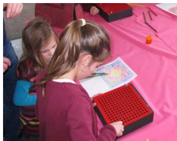
Grâce à des bâtons de couleurs différentes, les enfants ont pu reconstituer le relief lunaire !

Après avoir étudié les mouvements de la terre et des planètes à l'aide d'une sphère armillaire géante, les enfants ont pu, entre autres, réaliser chacun leur propre cadran solaire , ou encore se former à la méthode de cartographie du relief lunaire .