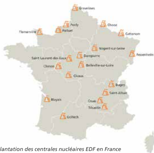
Implantation des centrales nucléaires EDF en France

La France est le 1 er pays au monde en nombre de réacteurs nucléaires en exploitation par habitant : 58 réacteurs pour plus de 67 millions de Français. Le nucléaire assure, en continu, l'essentiel de la production électrique française, contribuant très largement, avec les énergies renouvelables au très faible taux de CO 2 par kWh. Ces réacteurs sont implantés au sein de 19 centrales nucléaires réparties dans l'Hexagone. Avec le Grand Carénage, programme industriel de rénovation et de modernisation des installations, EDF souhaite poursuivre le fonctionnement de ses centrales après 40 ans .