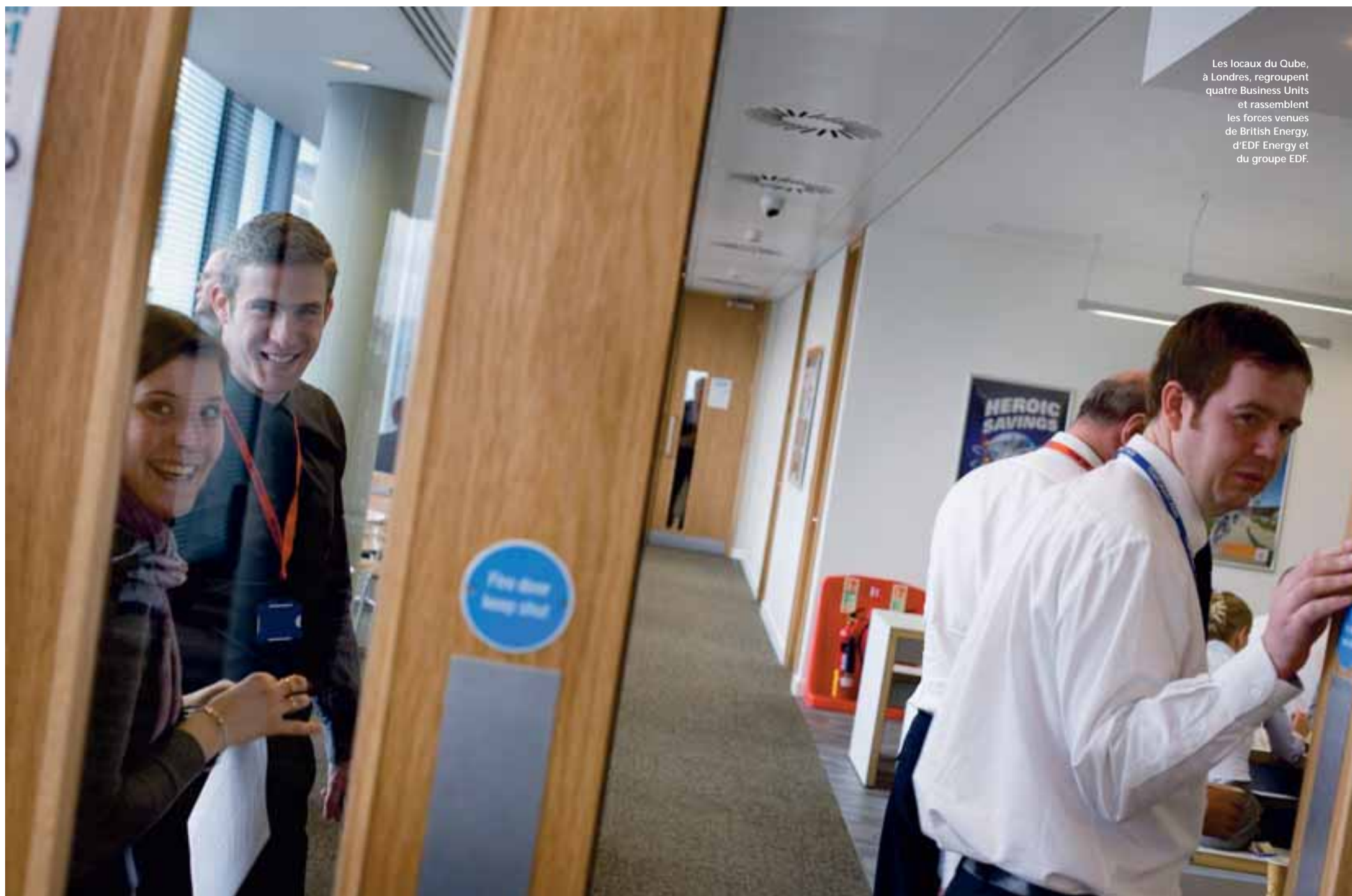
Les locaux du Qube, à Londres, regroupent quatre Business Units et rassemblent les forces venues de British Energy, d'EDF Energy et du groupe EDF.