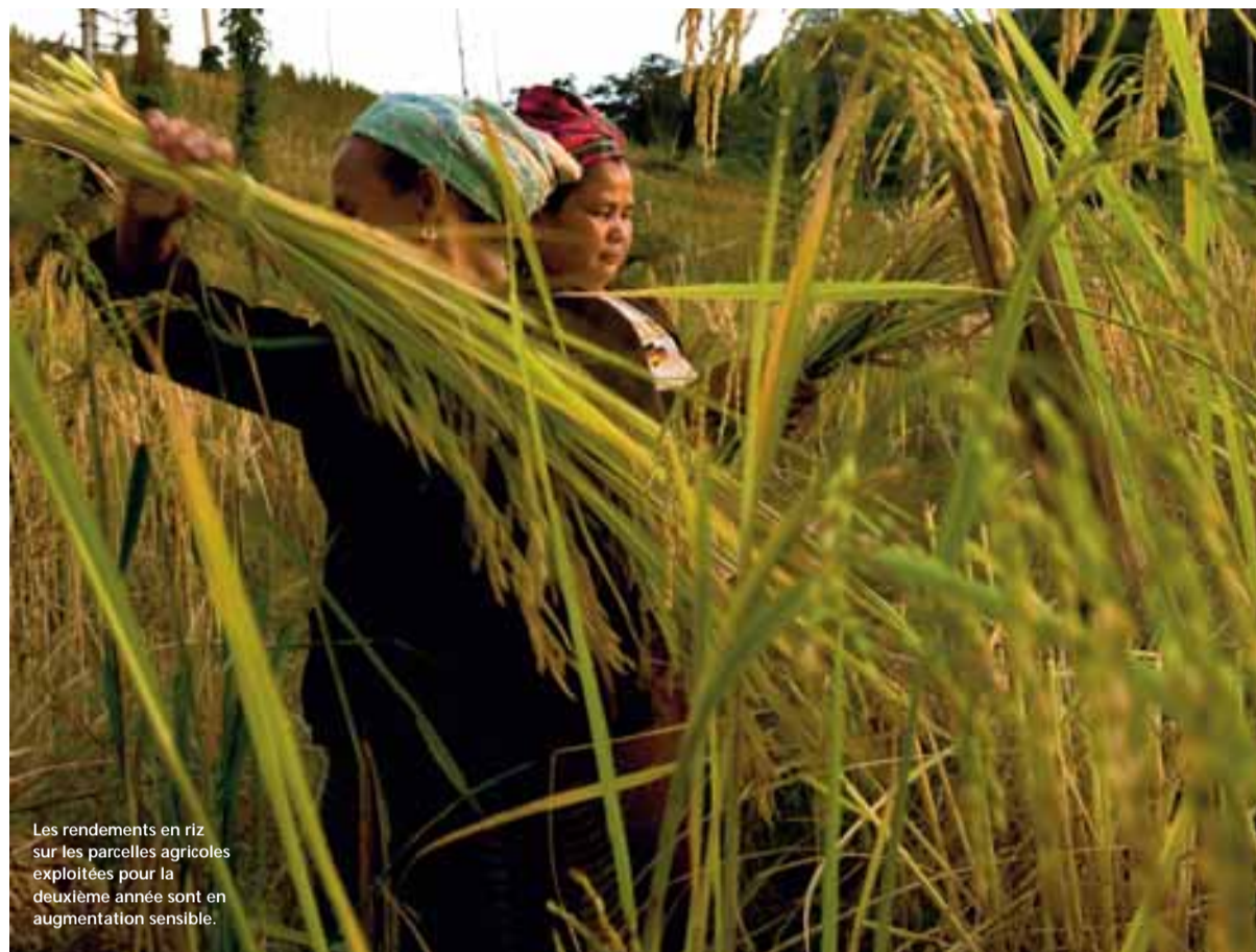
Les rendements en riz sur les parcelles agricoles exploitées pour la deuxième année sont en augmentation sensible.

L e réservoir du barrage couvre 450 km 2 à pleine capacité, inondant 14 villages, où vivaient quelque 6 300 habitants. Ces villages ont été réinstallés dans de nouvelles zones, avec des habitations de qualité, bénéficiant d'un accès à l'électricité et à l'eau potable et équipés d'installations sanitaires. Des routes ont été tracées, des bâtiments publics - écoles, dispensaires, marchés et salles communes - ont été édifiés. Chaque foyer s'est vu attribuer une parcelle de terre à cultiver et un droit de pâture dans une aire séparée. Autant d'atouts pour élever le niveau de vie et améliorer l'état sanitaire des villageois.