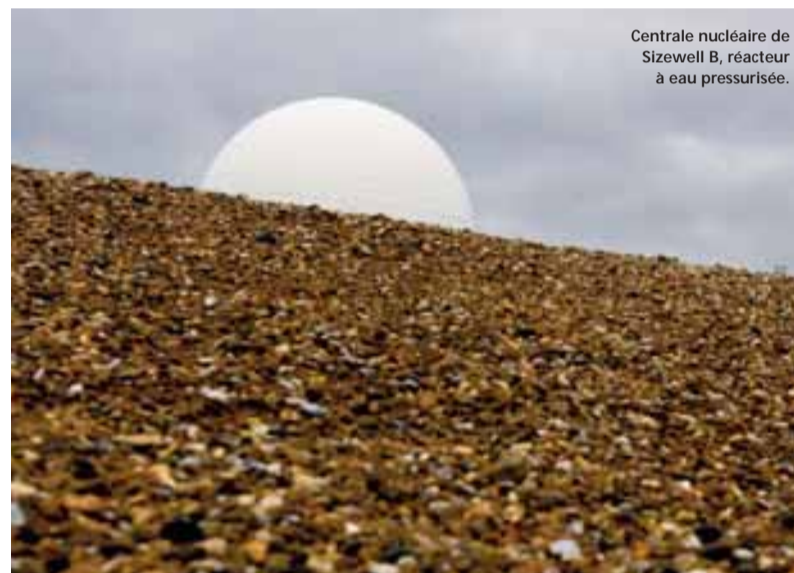
Centrale nucléaire de Sizewell B, réacteur à eau pressurisée.