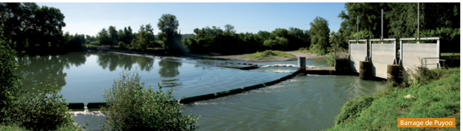
Barrage de Puyoo

E nergie renouvelable historique et stratégique, l'hydro-électricité permet en 2015 d'alimenter 520 000 habitants avec 36 centrales EDF. Ceci en préservant l'environnement et en respectant les autres usages de l'eau : soutien des débits en période estivale pour l'irrigation, gestion des niveaux d'eau lors des compétitions de canoë-kayak, préservation et connaissance des espèces protégées en partenariat avec la Ligue de Protection des Oiseaux (LPO), le Parc national des Pyrénées (PNP)... Compétitive, l'hydraulique fait l'objet, depuis plusieurs années, d'un plan de modernisation des matériels et des organisations sans précédent dans l'histoire d'EDF. Afin de garantir encore davantage la sûreté de ses ouvrages et d'en améliorer la performance, EDF a investi en 2015 dans ses installations situées sur les bassins versants de l'Adour, des Nives et des Gaves. En 2016, nous continuerons d'assurer pleinement notre mission d'exploitant hydroélectrique exemplaire afin de valoriser au maximum cette belle énergie renouvelable. Rénover nos ouvrages, innover dans notre exploitation, contribuer au développement des territoires sur lesquels nous sommes implantés constitueront les enjeux majeurs des 170 salariés d'EDF Hydraulique Adour et Gaves. Fortement engagés, nos collaborateurs auront à cœur de mener à bien ces priorités visant à conforter notre place de producteur hydroélectrique de référence, à l'écoute et impliqué sur ses territoires.