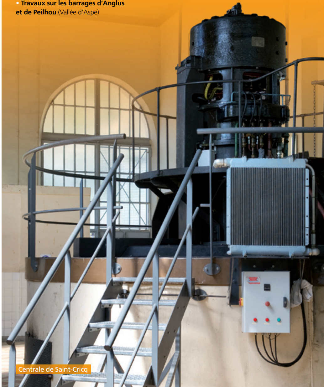
Centrale de Saint-Cricq