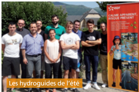
Les hydroguides de l'été