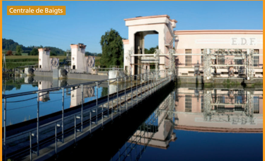
Centrale de Baigts